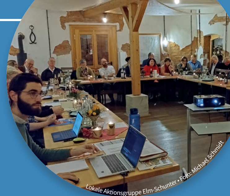
Lokale Aktionsgruppe Elm-Schunter